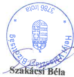
Szakácsi Béla az Irotai Helyi Választási Bizottság elnöke

Az Irotai Helyi Választási Bizottság 20/2019. (X.13.) határozata melléklete